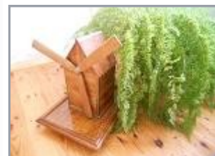
ЭКСПЛУАТАЦИЯ ОБОРУДОВАНИЯ И ТЕХНОЛОГИЯ ДЕРЕВООБРАБАТЫВАЮЩИХ ПРОИЗВОДСТВ